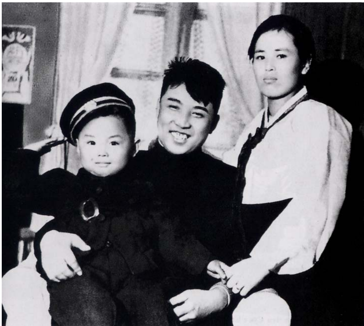
Ким Чен Сук с Ким Ир Сен и сыном.