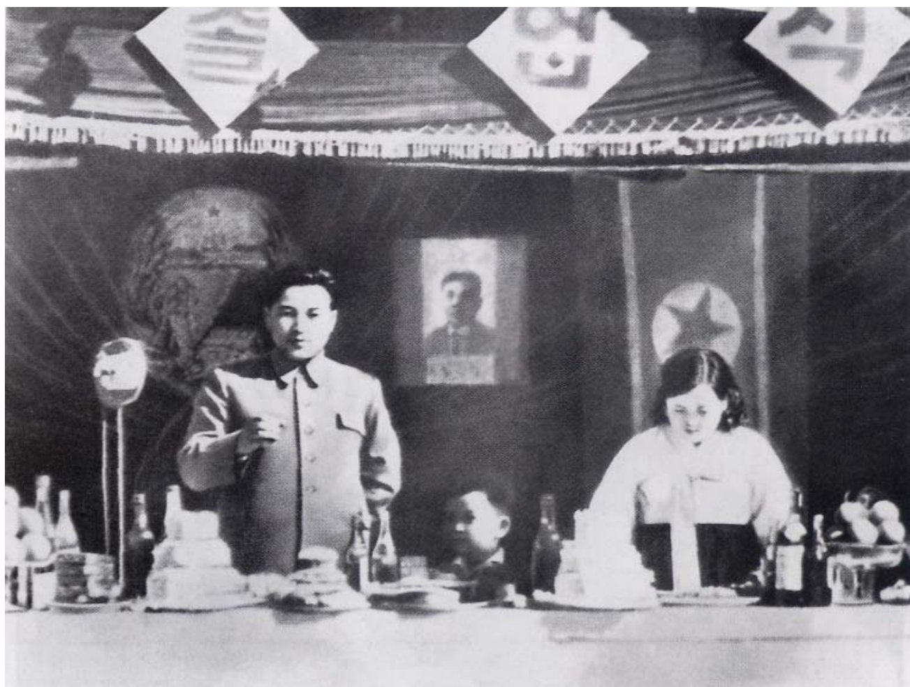
Ким Чен Сук с Ким Ир Сенем и сыном на церемонии по случаю второго выпуска Первого центрального военного училища.