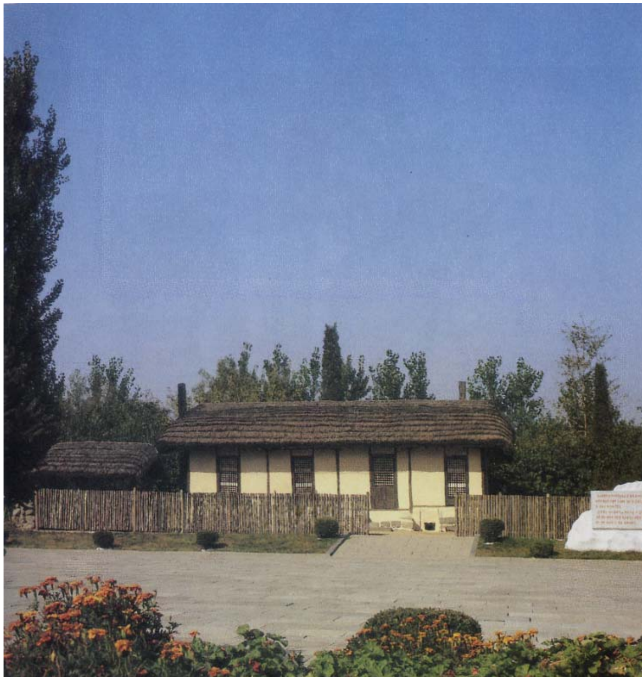
Родной дом Ким Чен Сук в Хвэрене.