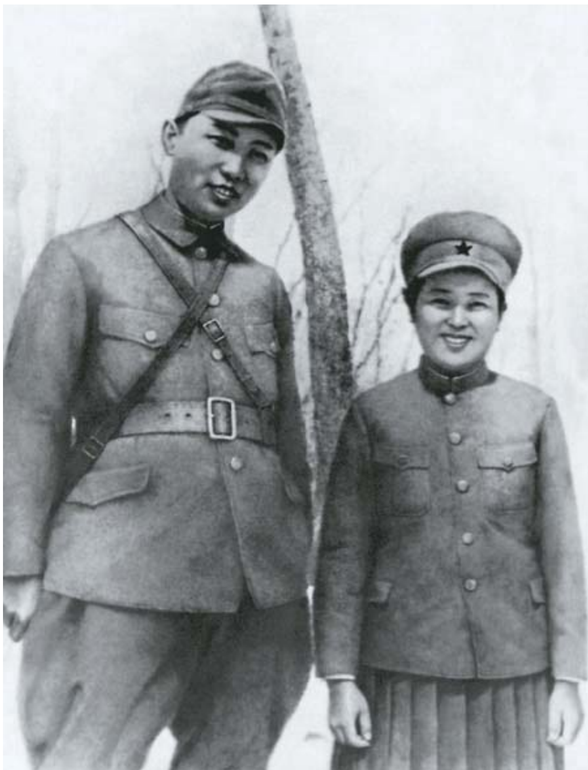
Ким Ир Сен и Ким Чен Сук в дни вооруженной борьбы против японских захватчиков.