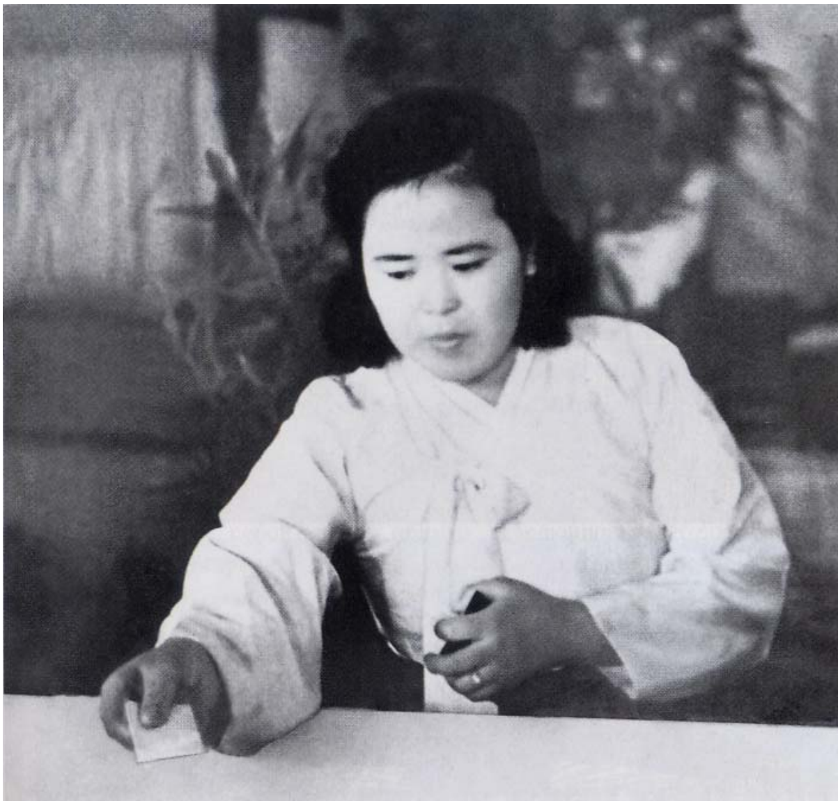
Ким Чен Сук принимает участие в выборах депутатов в органы народной власти.